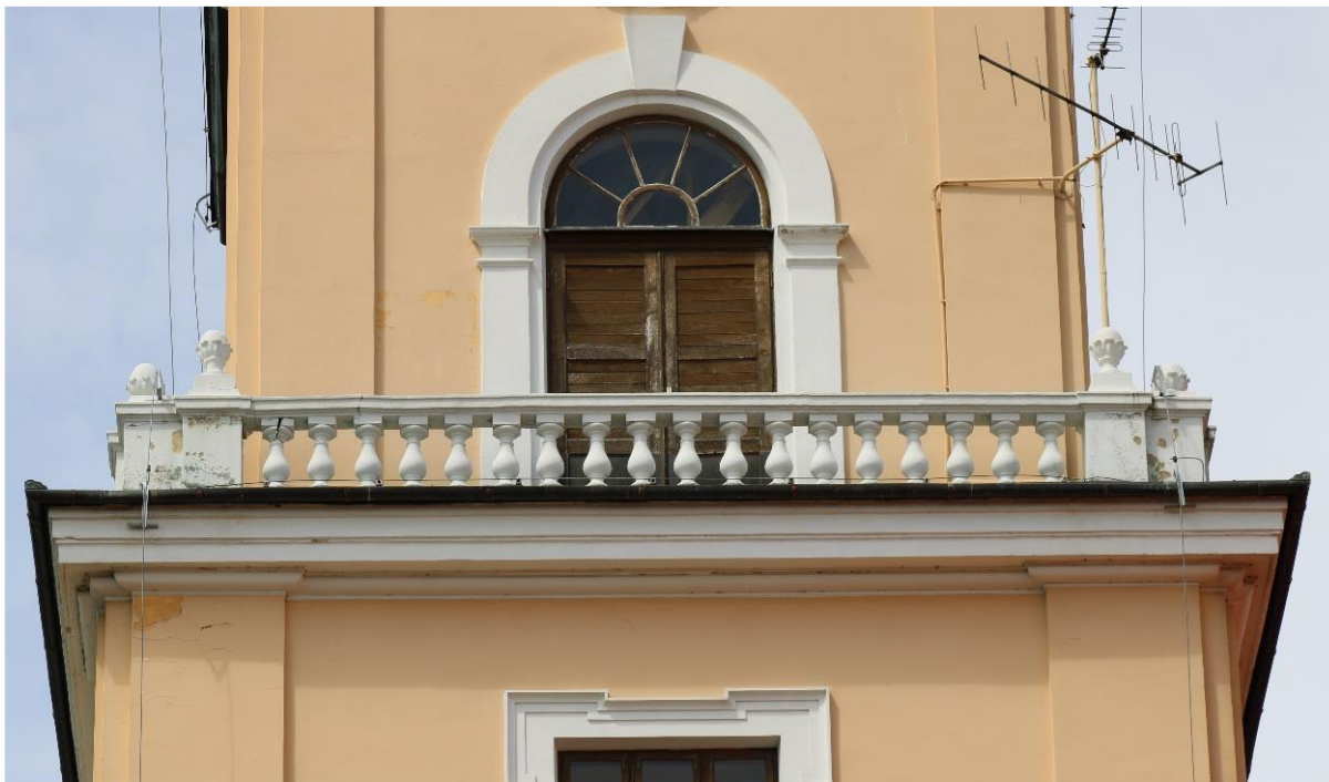
Stan po zakończeniu prac: