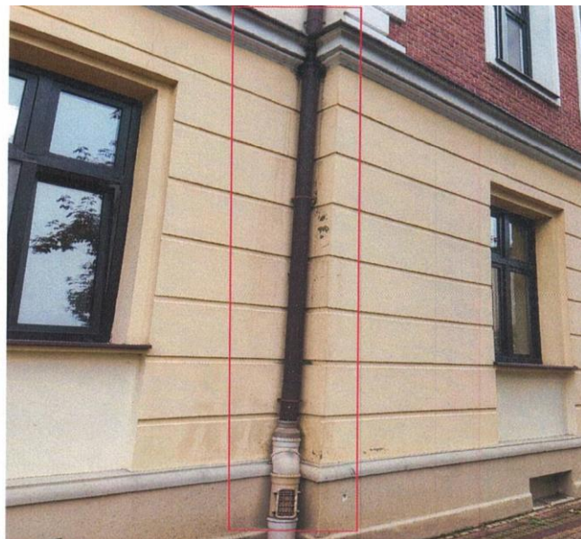
zdj. nr 13 – fragment elewacji przeznaczony do remontu