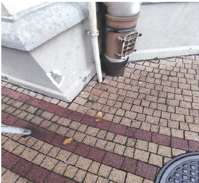
zdj. nr 12 – fragment elewacji przeznaczony do remontu