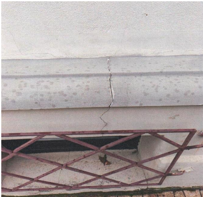
zdj. nr 10 – fragment elewacji przeznaczony do remontu