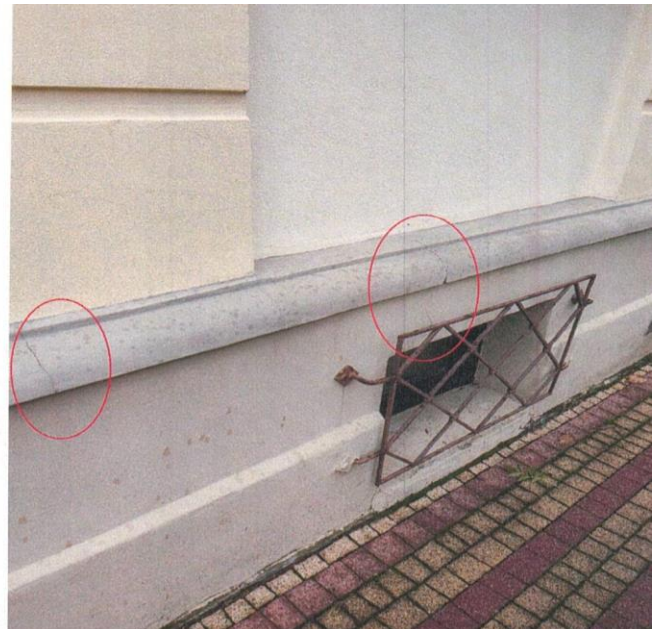
zdj. nr 11 – fragment elewacji przeznaczony do remontu