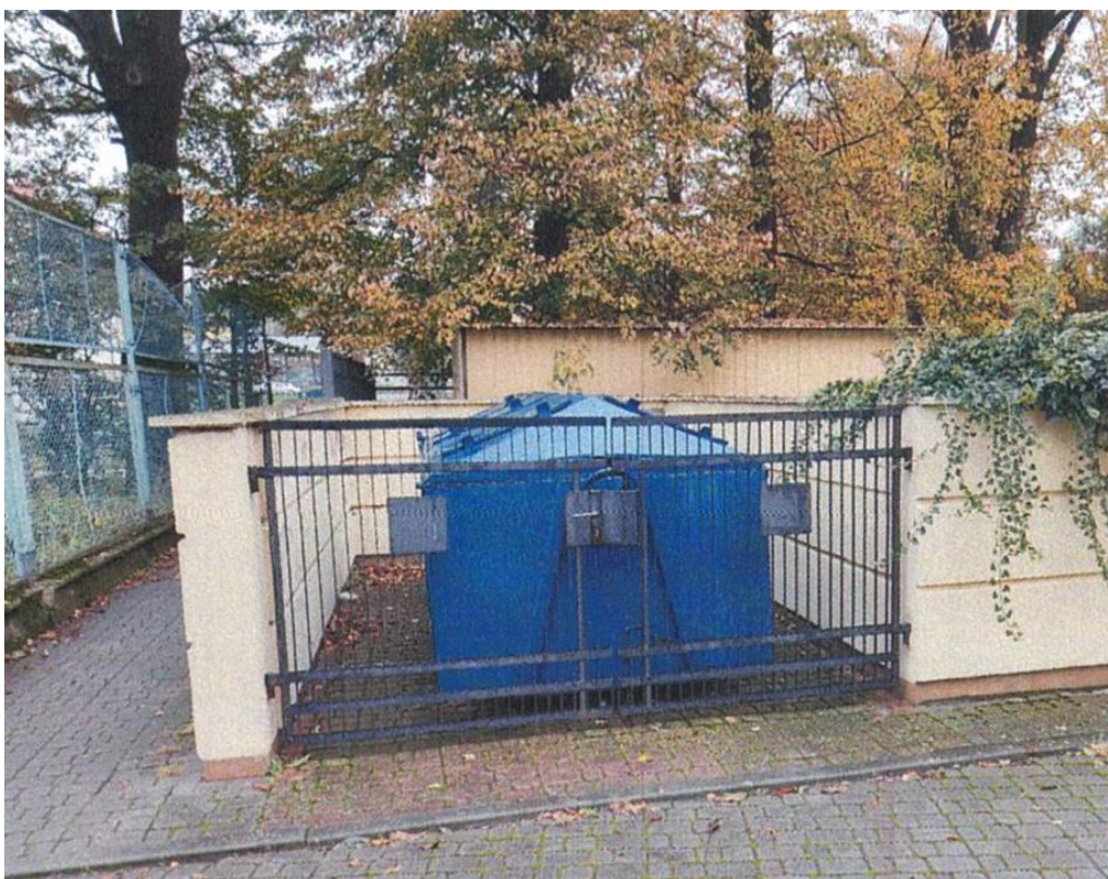
zdj. nr 14 – renowacja elementów stalowych