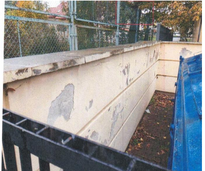
zdj. nr 16 – fragment elewacji przeznaczony do remontu