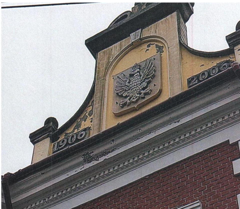
zdj. nr 2 – fragment elewacji przeznaczony do remontu