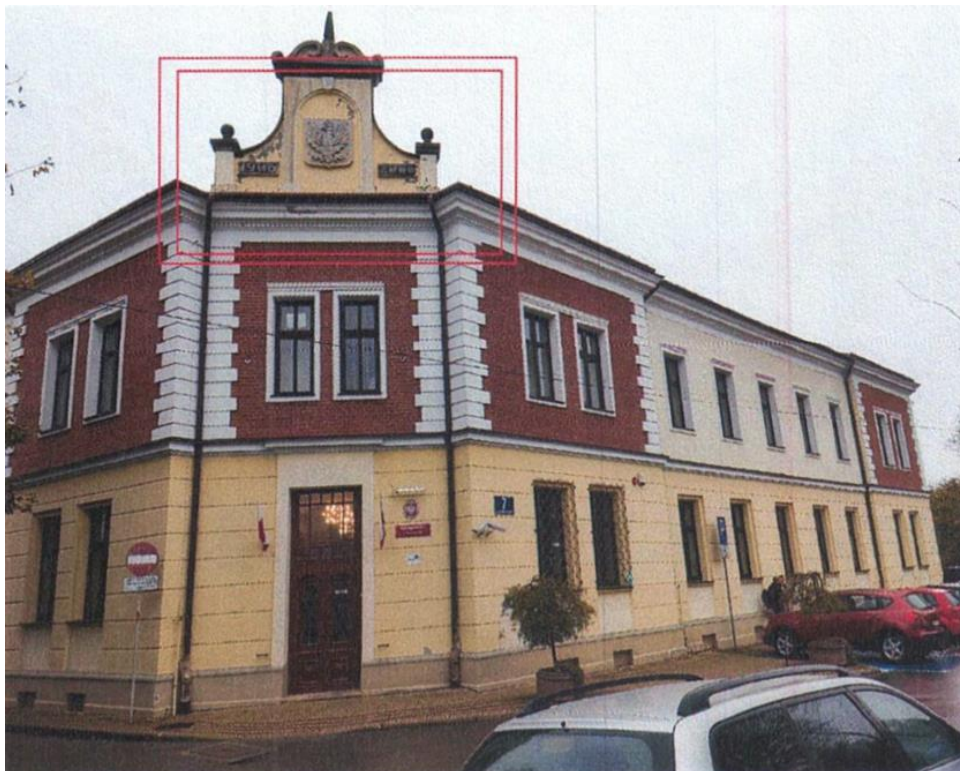
zdj. nr 1 – fragment elewacji przeznaczony do remontu oraz montażu zadaszenia nad wejściem głównym