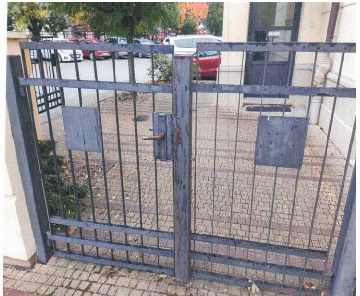
zdj. nr 17 – renowacja elementów stalowych